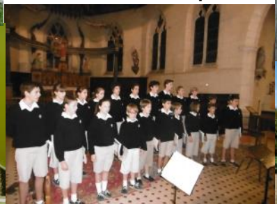
Concerts de Noël à Saint-Charles - déc. 2014 Concert au Bon Marché 85 ans de Louis