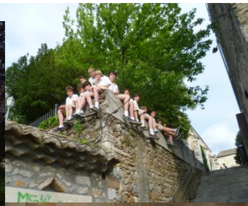
Stage et tournée en Ardèche - juillet