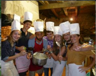
WE de septembre aux Grandes Haies - sept. 2014