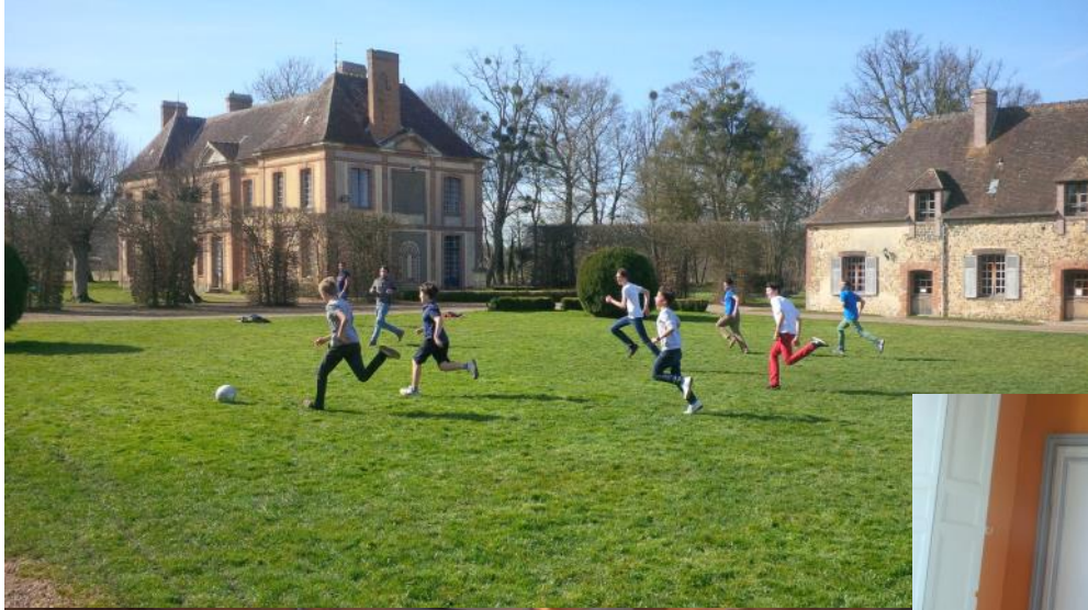
WE de répétition aux Grandes Haies avec le chœur d'hommes 7 et 8 mars 2015